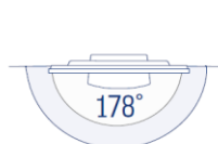
Écran grand angle de la plus haute qualité